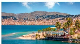
VELIKA ALBANSKA AVANTURA 29.5. že za 859 € na osebo