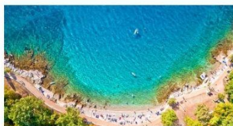
hotel/dep. NO NAME 4* Istra/Kvarner - ALL INC 11.6. že za 499 € na osebo