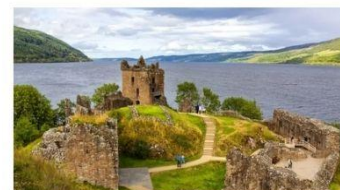
ŠKOTSKE LEGENDE - po deželi viskija, dud in kiltov 28.6. že za 1.890€ na osebo