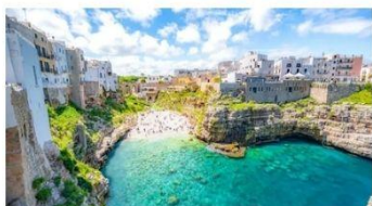
APULIJA - dežela sonca in slikovitih mest 29.5. že za 880 € na osebo