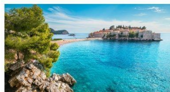
hotel NO NAME 3* Budva - HB + ✈️ 17.6. že za 499 € na osebo