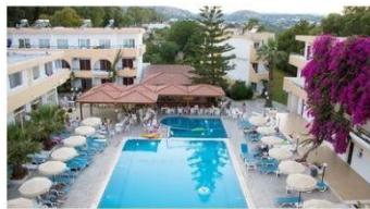
hotel MARATHON 4* - ALL INC + ✈️ že za 799 € na osebo