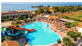
hotel IONIAN SEA 4* - ALL INC + ✈️ že za 799 € na osebo