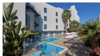
hotel POLLIS 4* - ALL INC + ✈️ že za 799 € na osebo