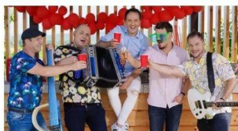
OTVORITEV SEZONE v ZADRU 3* - ALL INC + 🚗 7.6. že za 659 € na osebo

Za vse člane Zveze reprezentativnih sindikatov DODATNI 5 % POPUST na osnovno ceno paketnega aranžmaja v organizaciji Relax turizma.